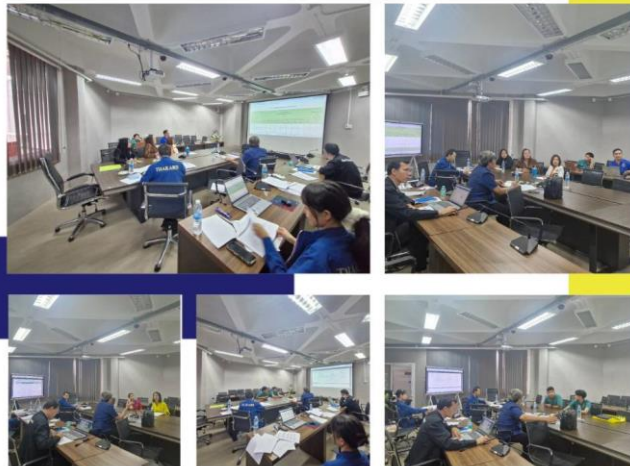
การประชุมติดตาม ITA